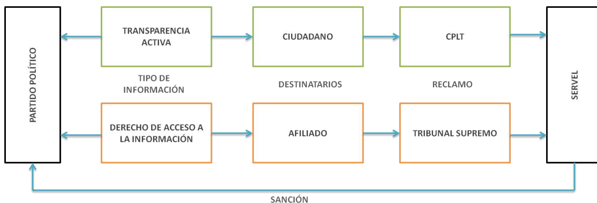
Ilustración 2: Modelo de transparencia en partidos políticos

obligaciones de transparencia, sino que dos órganos en un área de acción específica, tal como se muestra en la ilustración número 2.